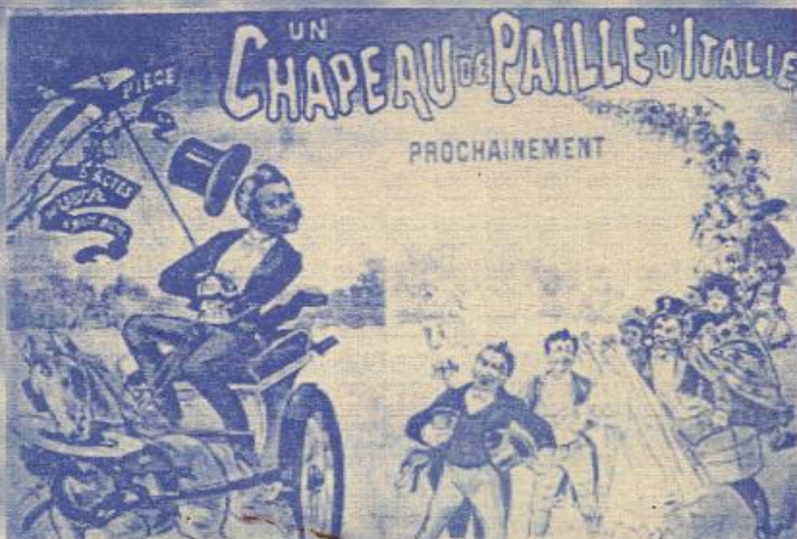
Πρώτη παράσταση του «Καπέλλο από φάθα Ιταλίας» - 14 Αυγούστου 1851 Palais Royal, Paris