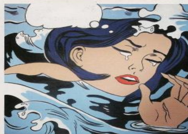
Οι πίνακες του σκηνικού είναι αντίγραφα έργων του Roy Lichtenstein